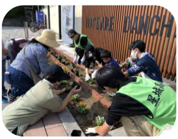
「花溢れる街プロジェクト」